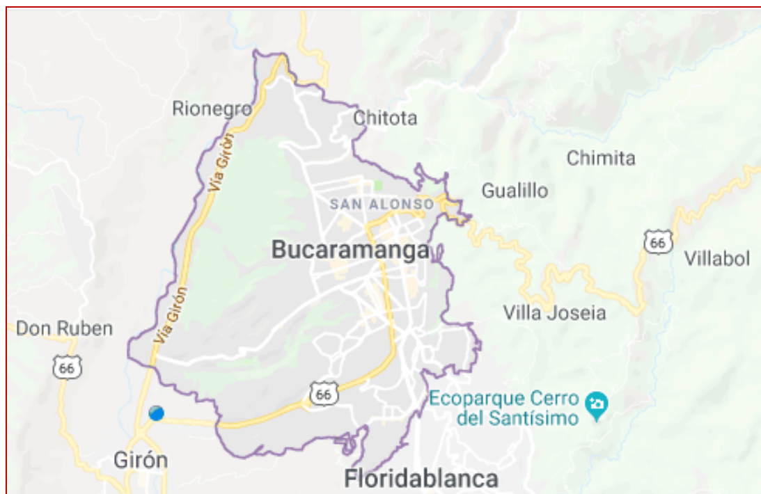
Mapa: Area Prestación servicio Municipio Bucaramanga