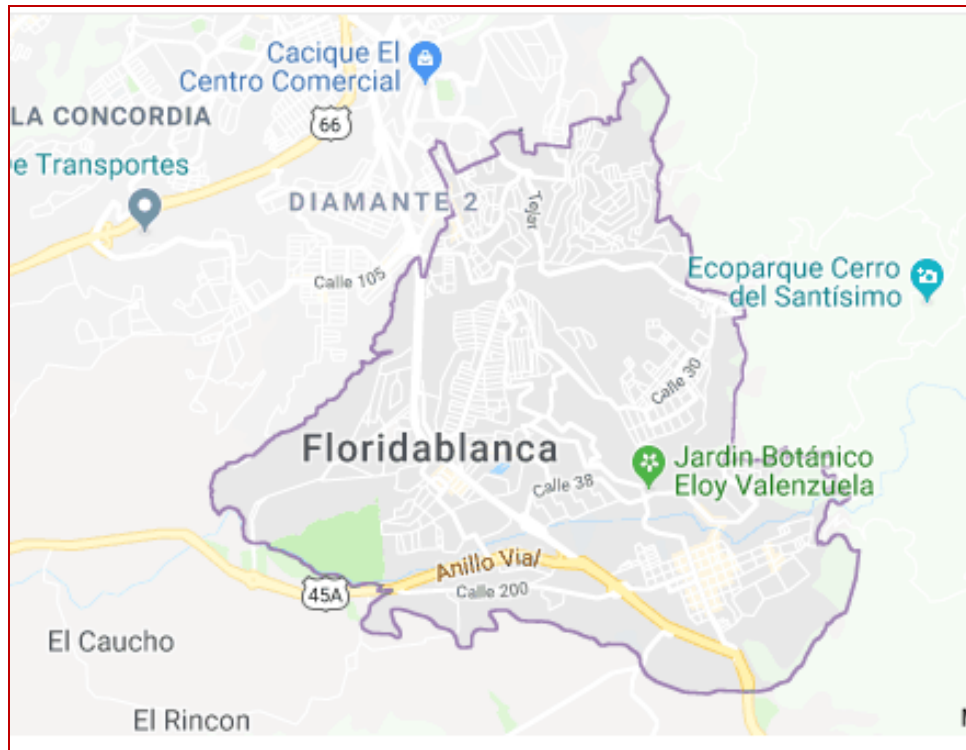
Mapa: Area Prestación servicio Municipio Floridablanca