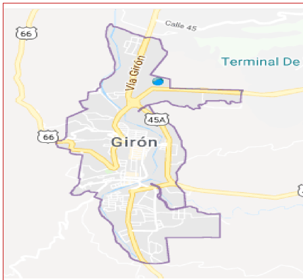
Mapa: Area Prestación servicio Municipio Girón

Cláusula 8. PUBLICIDAD. El prestador del servicio deberá publicar de forma sistemática y permanente, en su página web, en los centros de atención al usuario y en las oficinas de peticiones, quejas y recursos, la siguiente información para conocimiento del suscriptor y/o usuario: